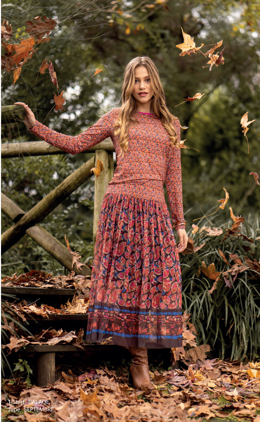
T-Shirt BALADE Jupe SEPTEMBRE