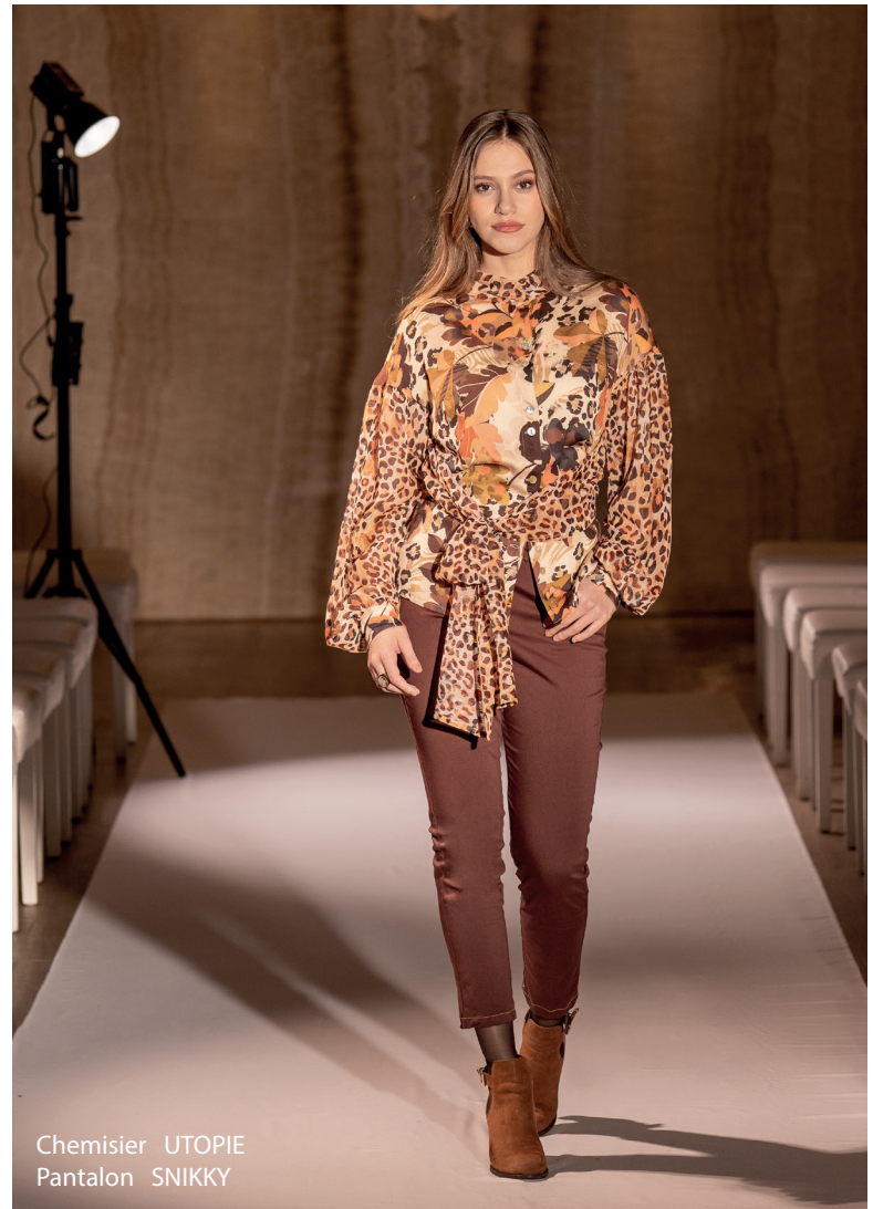
Chemisier UTOPIE Pantalon SNIKKY