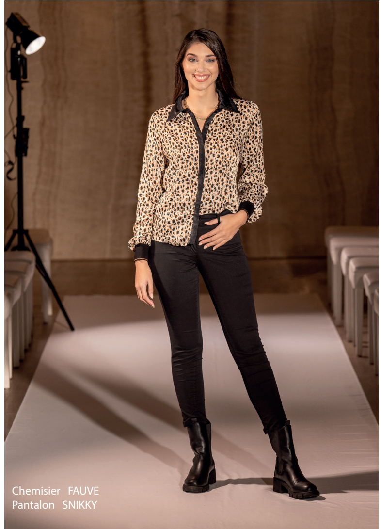
Chemisier FAUVE Pantalon SNIKKY