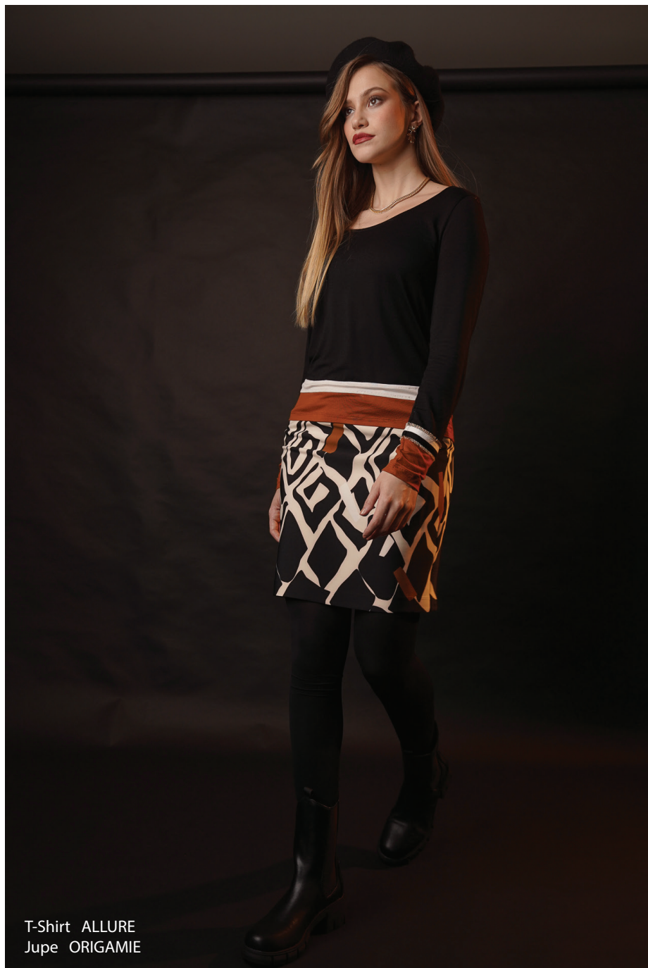
T-Shirt ALLURE Jupe ORIGAMIE