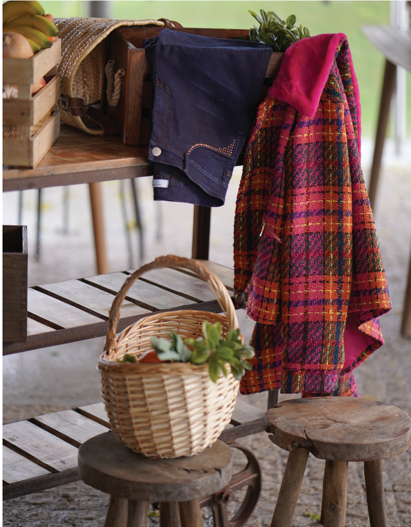
Manteau COMPLICE Pantalon DENIM