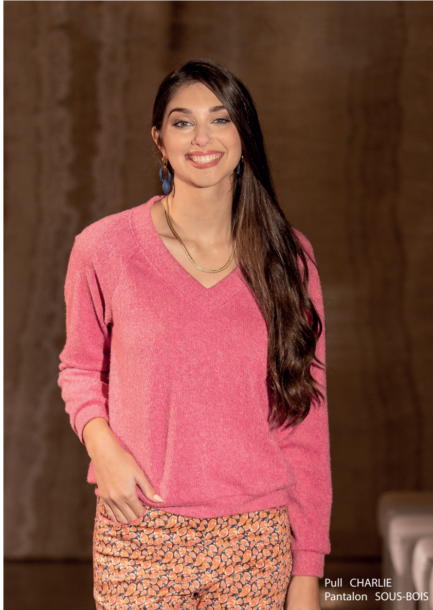
Pull CHARLIE Pantalon SOUS-BOIS