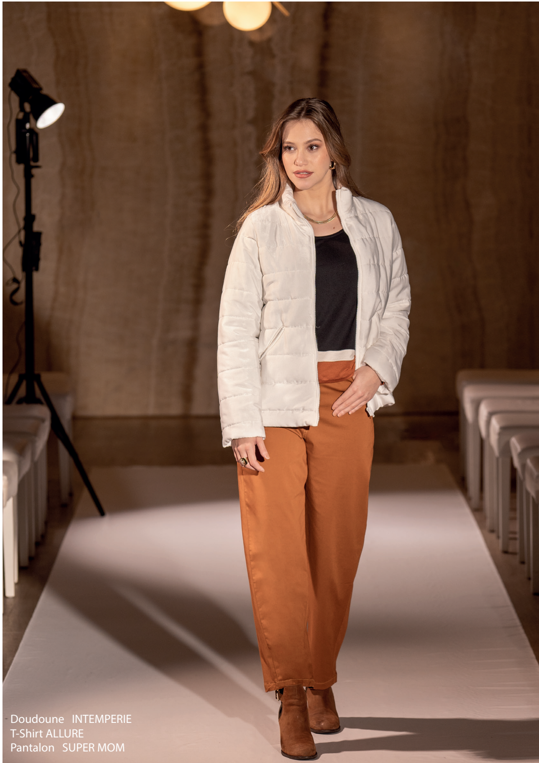
Doudoune INTEMPERIE T-Shirt ALLURE Pantalon SUPER MOM