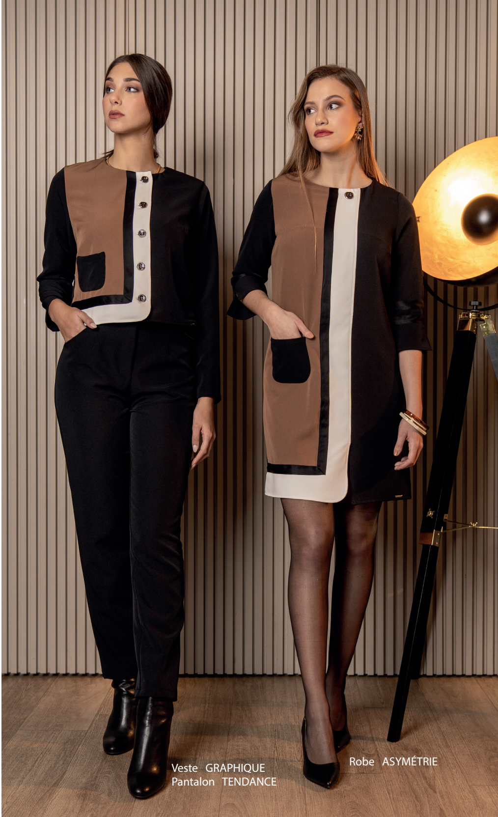
Veste GRAPHIQUE Pantalon TENDANCE