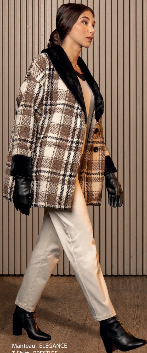
Manteau ELEGANCE T-Shirt PRESTIGE Pantalon MOM