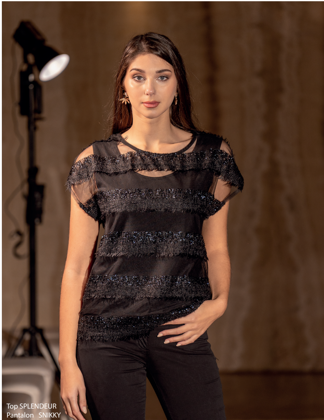
Top SPLENDEUR Pantalon SNIKKY