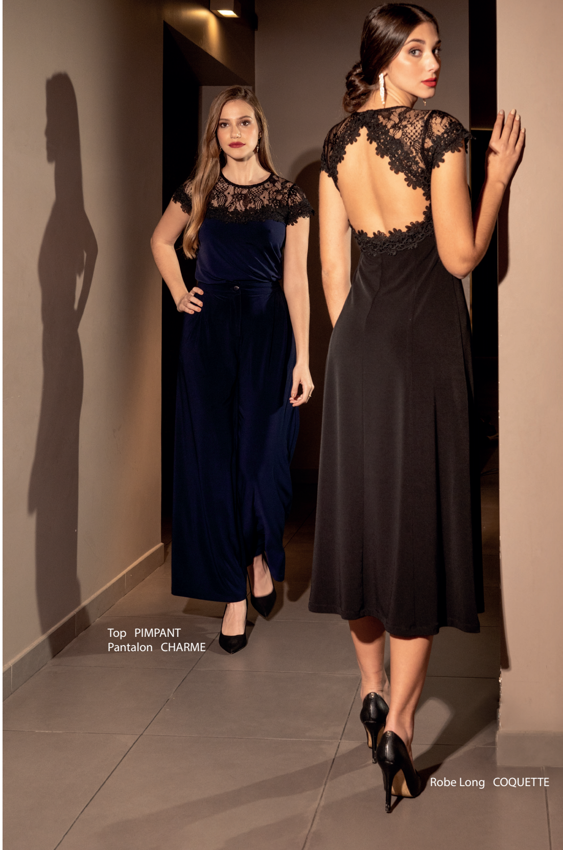
Top PIMPANT Pantalon CHARME