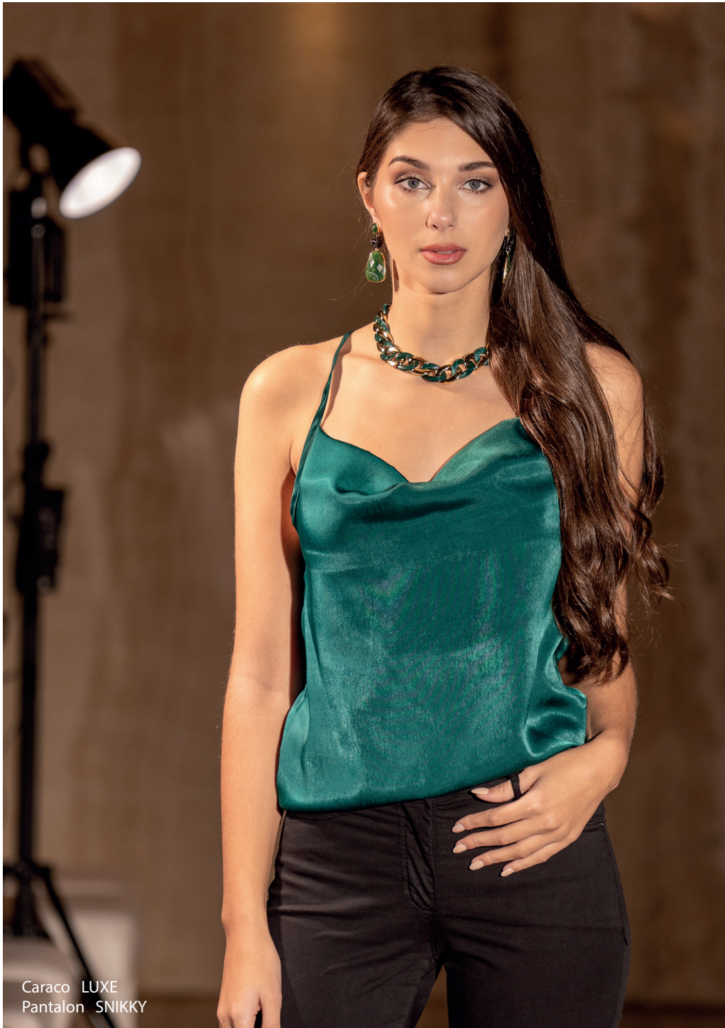
Caraco LUXE Pantalon SNIKKY