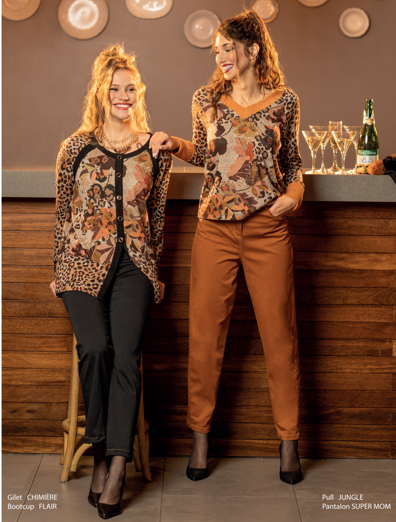
Gilet CHIMIÈRE Bootcup FLAIR