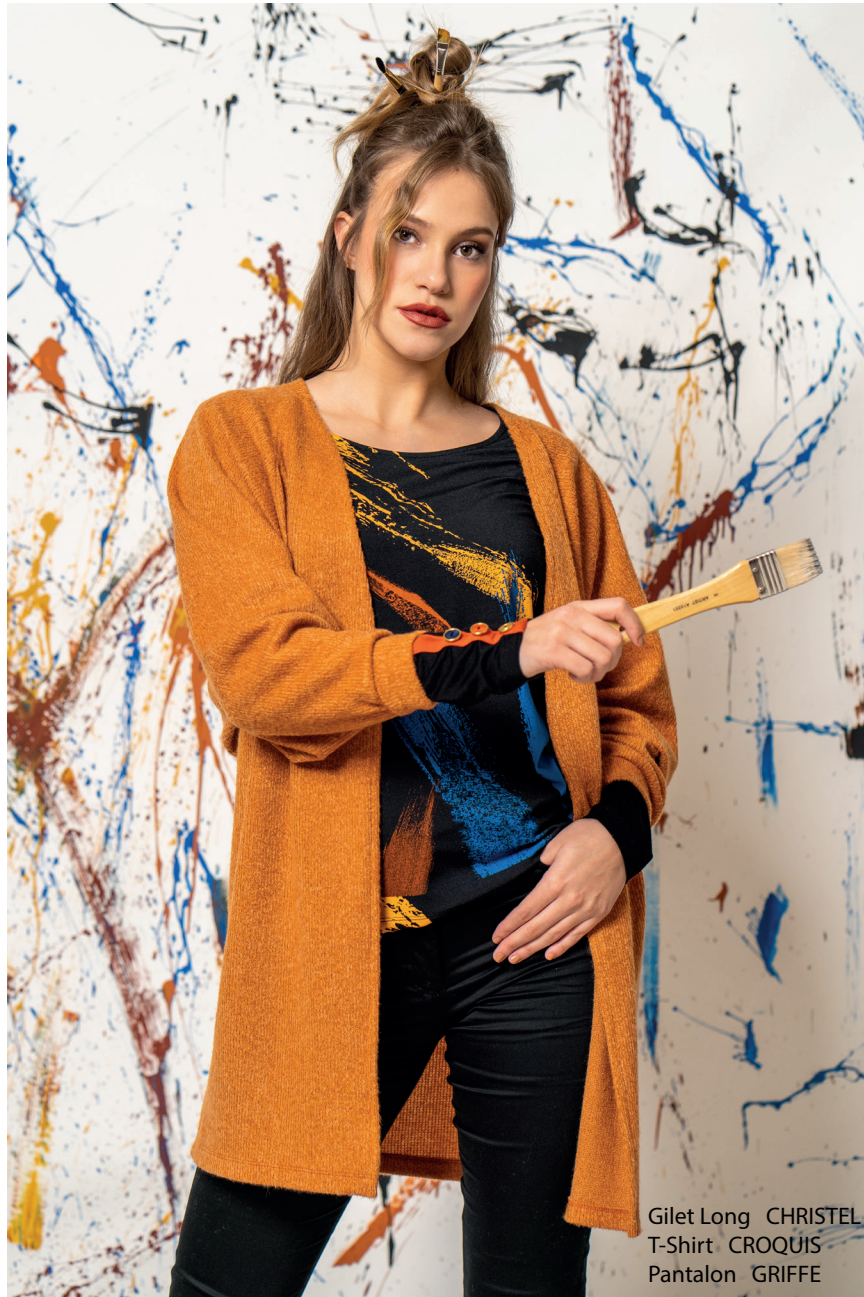
Gilet Long CHRISTEL T-Shirt CROQUIS Pantalon GRIFFE