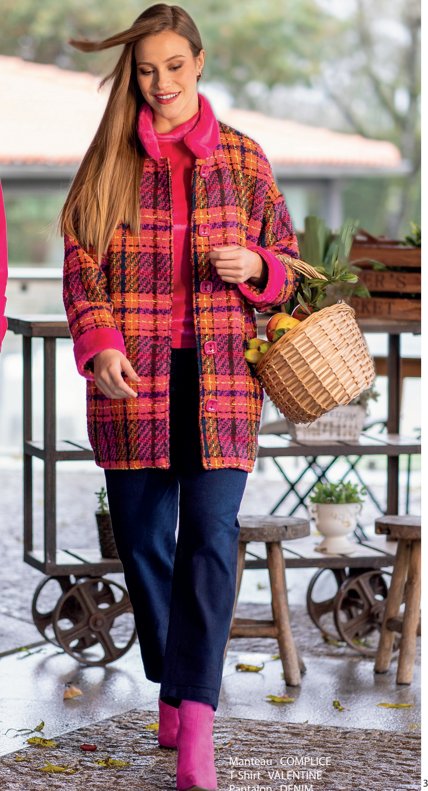
Manteau COMPLICE T-Shirt VALENTINE Pantalon DENIM