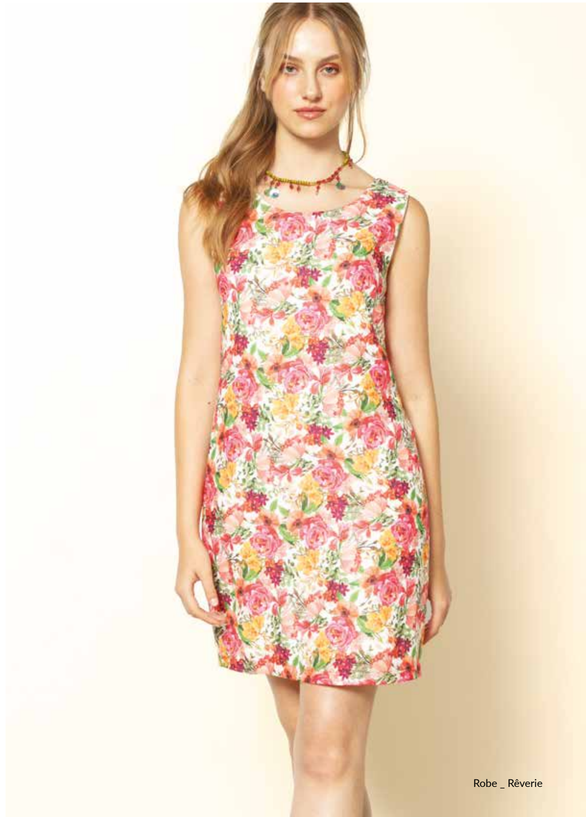
Robe _ Rêverie