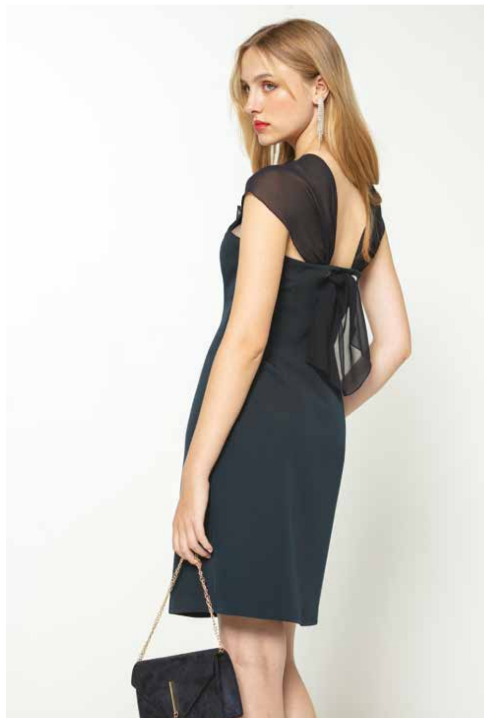
Robe _ Gala