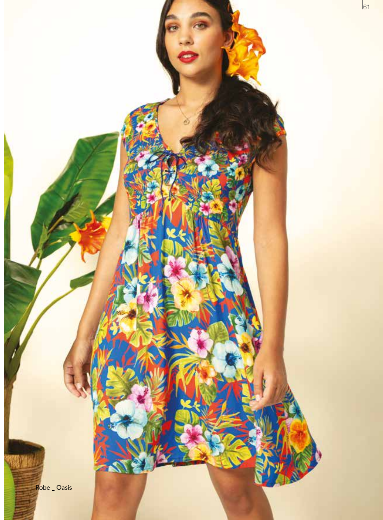
Robe _ Oasis