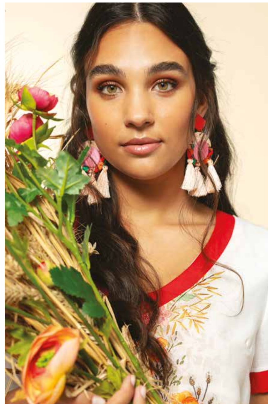
Robe _ Excursion