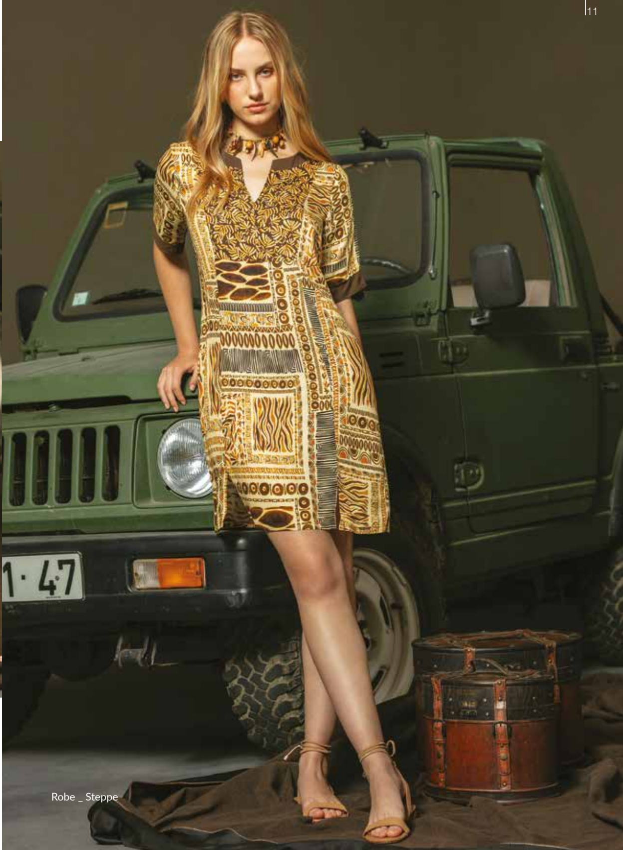
Robe _ Steppe