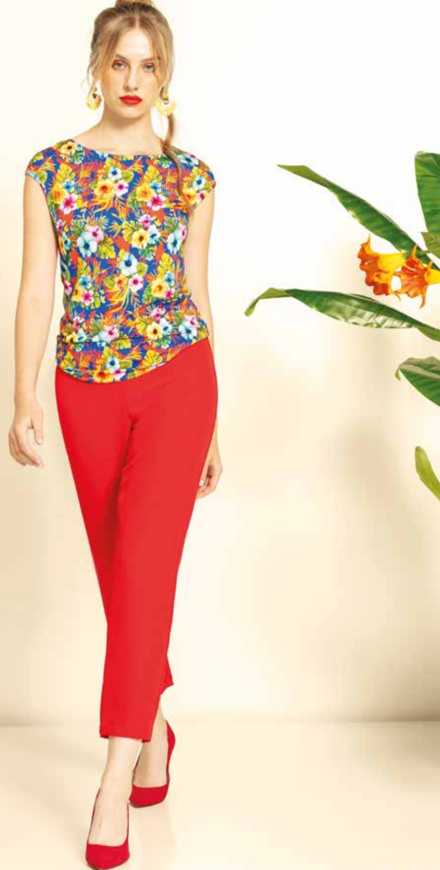
Pantalon _ Miss Tshirt _ Moorea