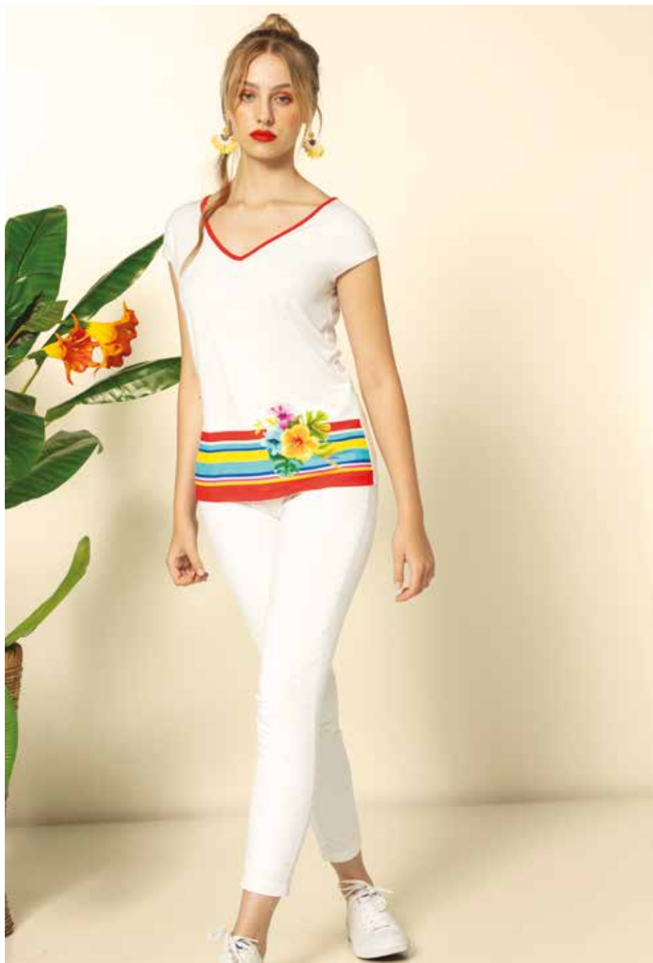
Pantalon _ Sniky 7/8e Tshirt _ Atoll