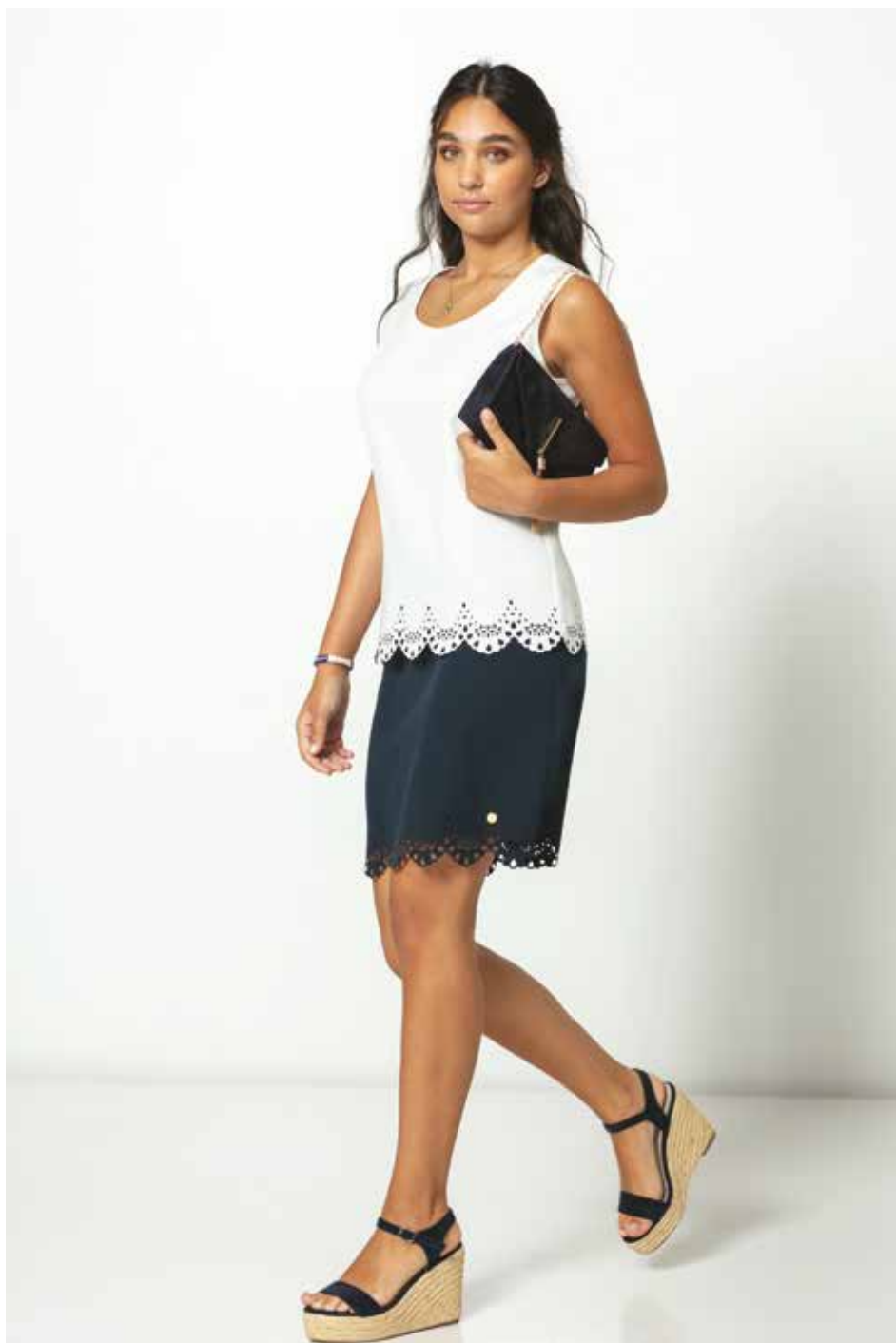
Jupe _ Chipie Top _ Kandy