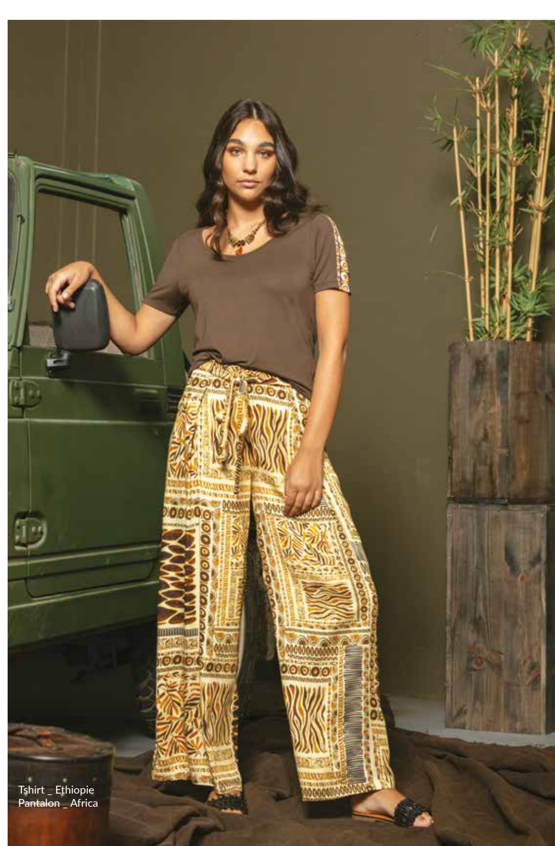
Tshirt _ Ethiopie Pantalon _ Afrique