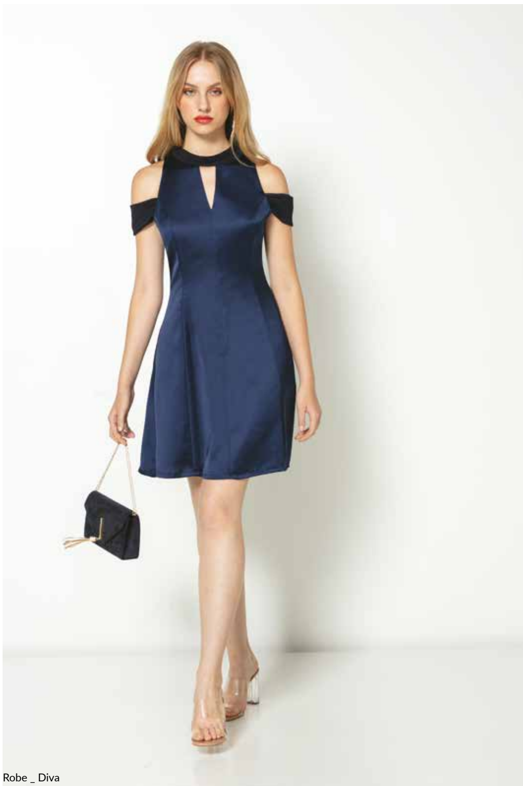
Robe _ Diva