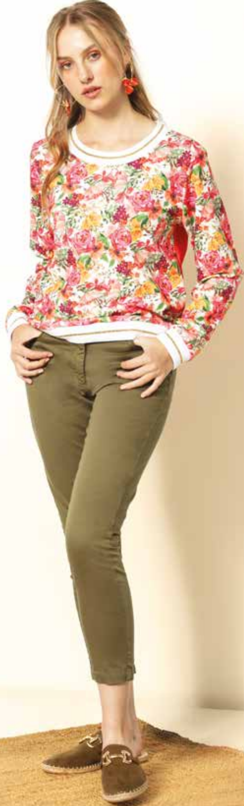
Pantalon s_niky 7/8e Sweat _ Musardise