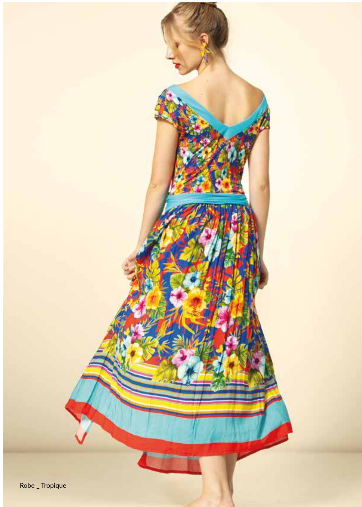
Robe _ Tropicque