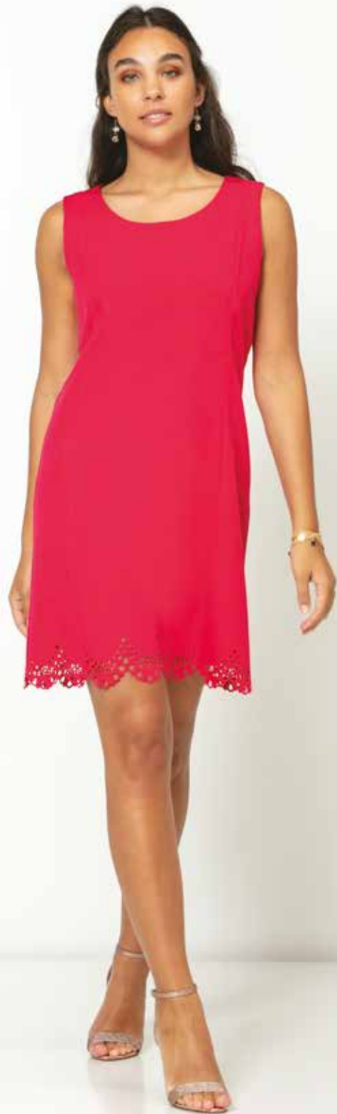
Robe _ Lolita