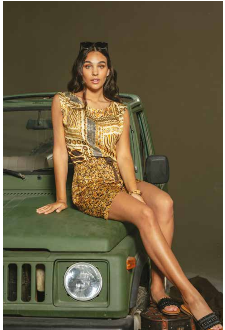
Top _ Namibie Short _ Baobab