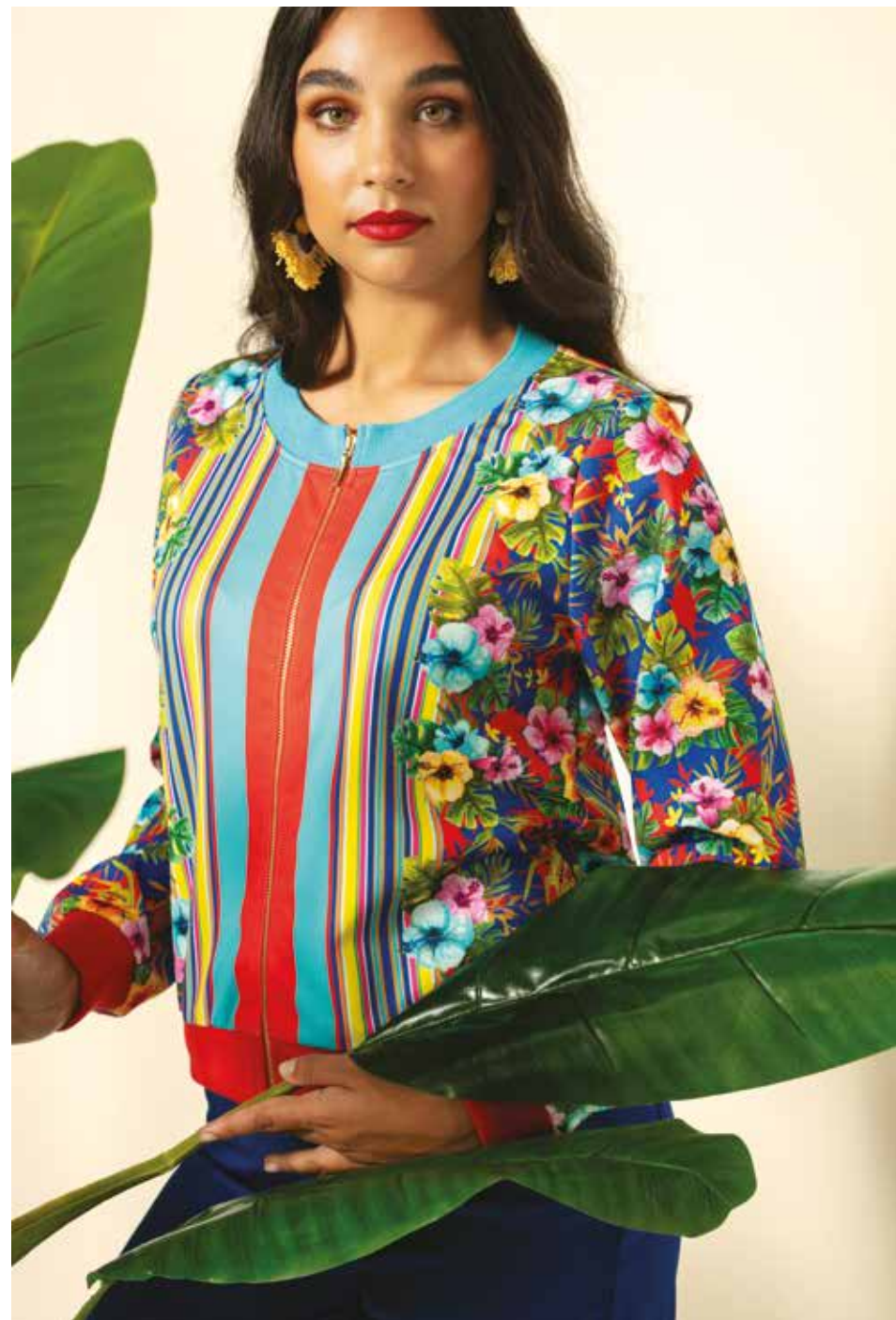
Bombers _ Martinique