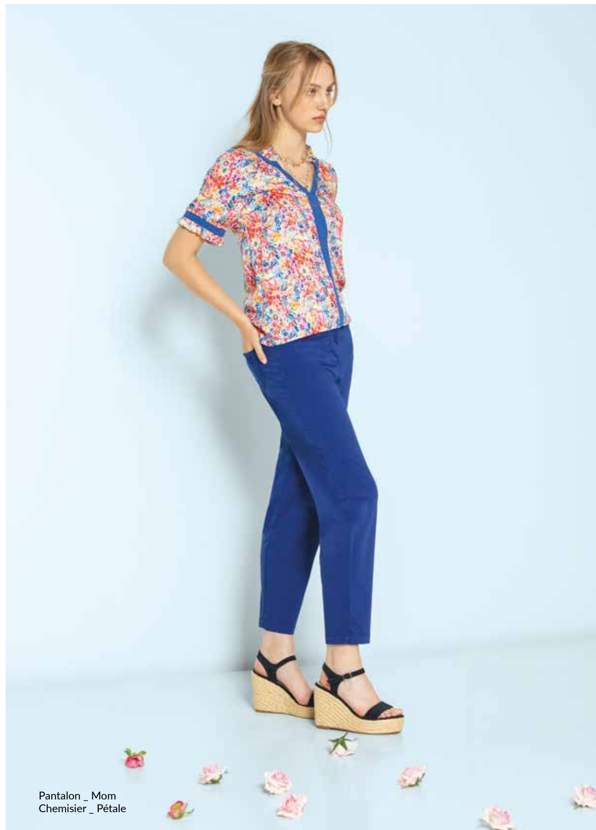
Pantalon _ Mom Chemisier _ Pétale