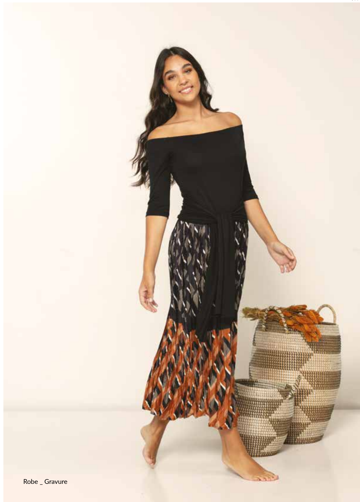
Robe _ Gravure