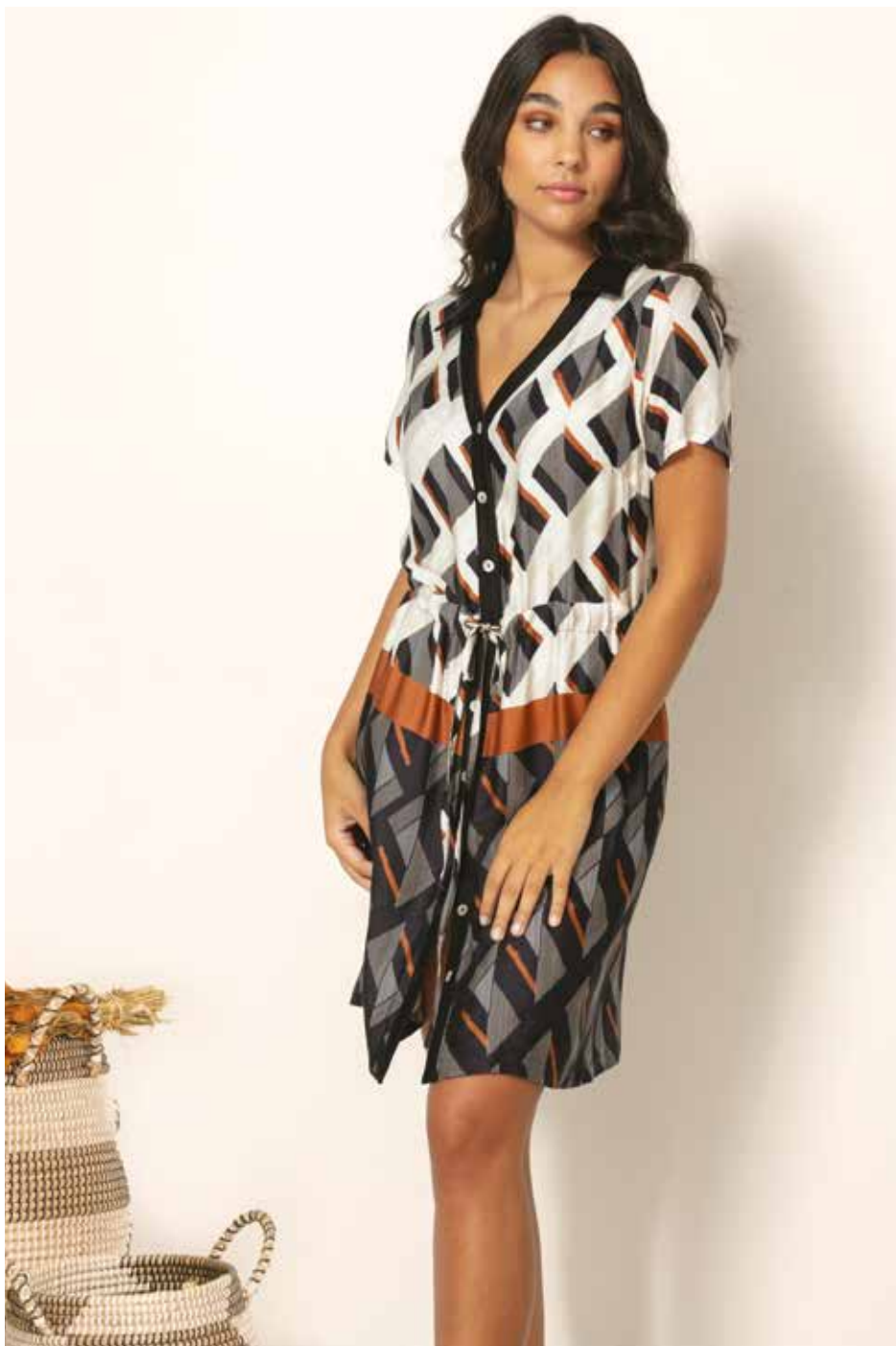
Robe _ ZIGZAG