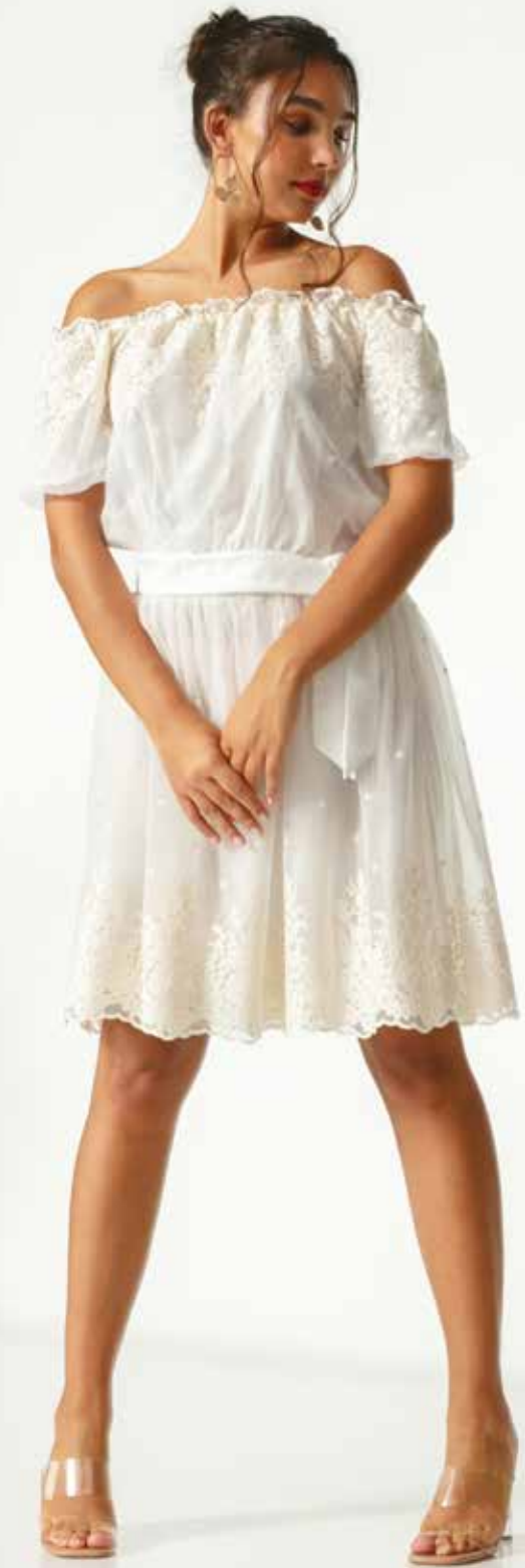
Jupe _ Diamant Top _ Diamème