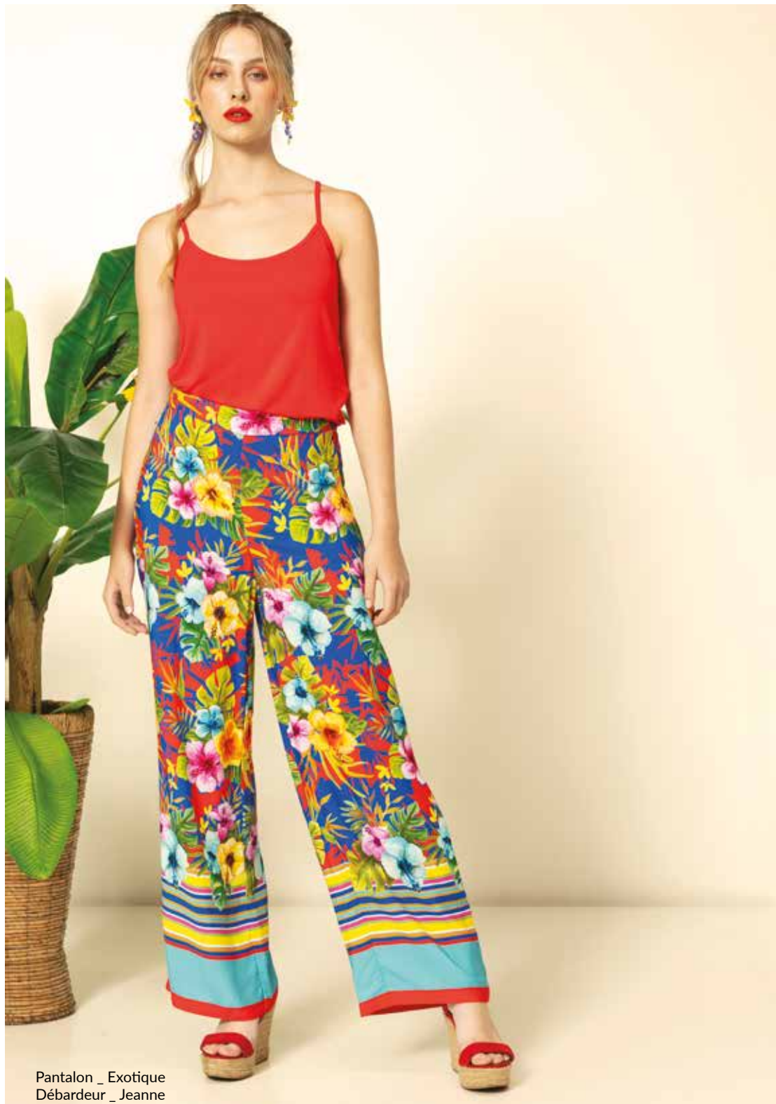
Pantalon _ Exotique Débardeur _ Jeanne