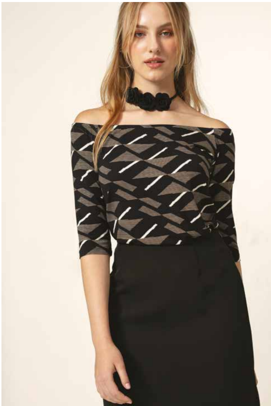
Jupe _ Princesse Top _ Tempo