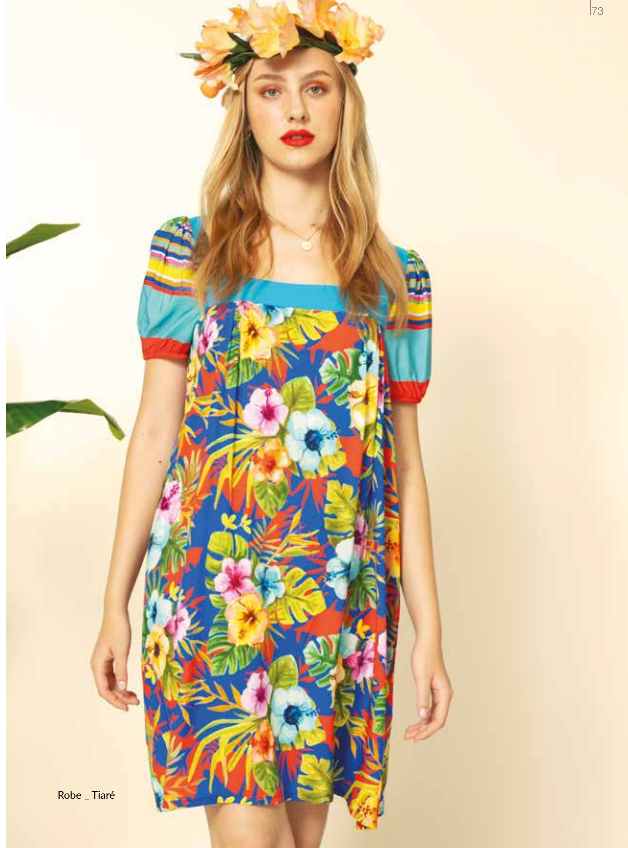
Robe _ Tiaré