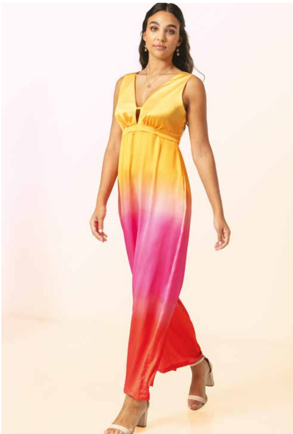
Combinaison _ Illusion