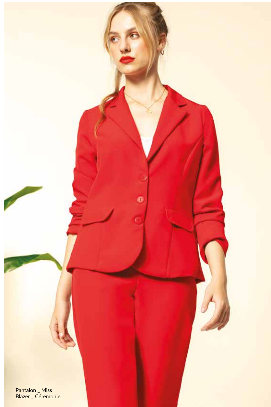
Pantalon _ Miss Blazer _ C er monie