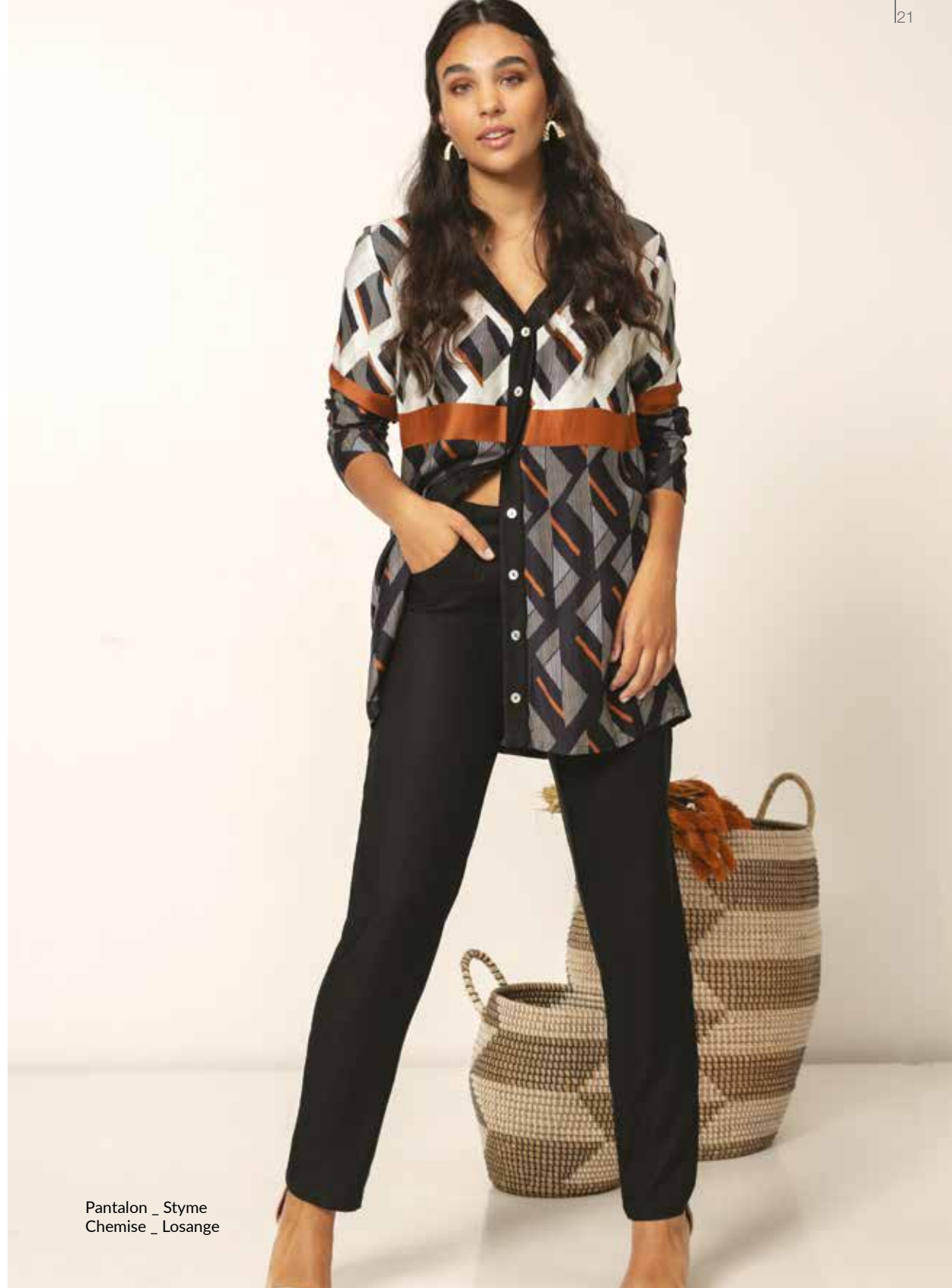
Pantalon _ Styme Chemise _ Losange