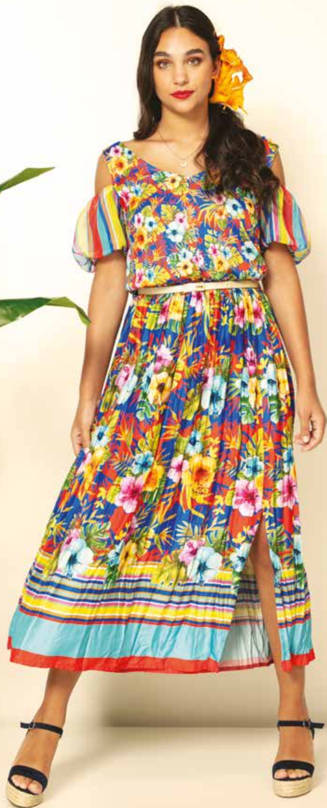
Robe _ Tahiti