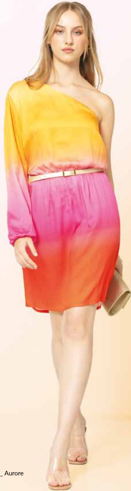
Robe _ Aurore