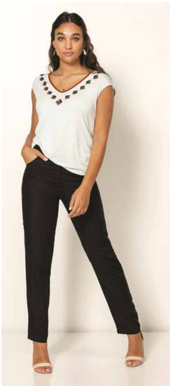
Tshirt _ Alliance Pantalon _ Snikky