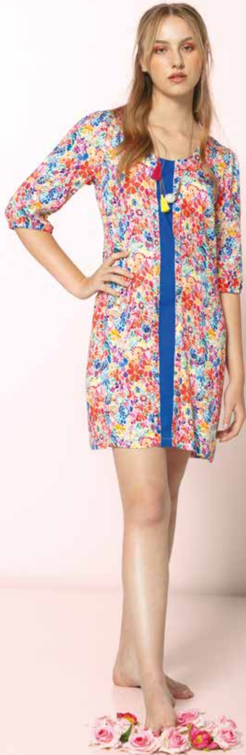
Robe _ Quartz