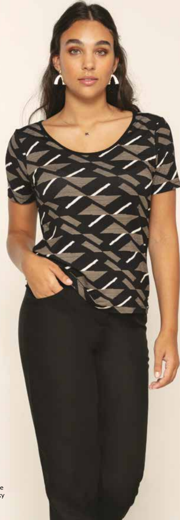
Tshirt _ Optique Pantalon _ Sniky