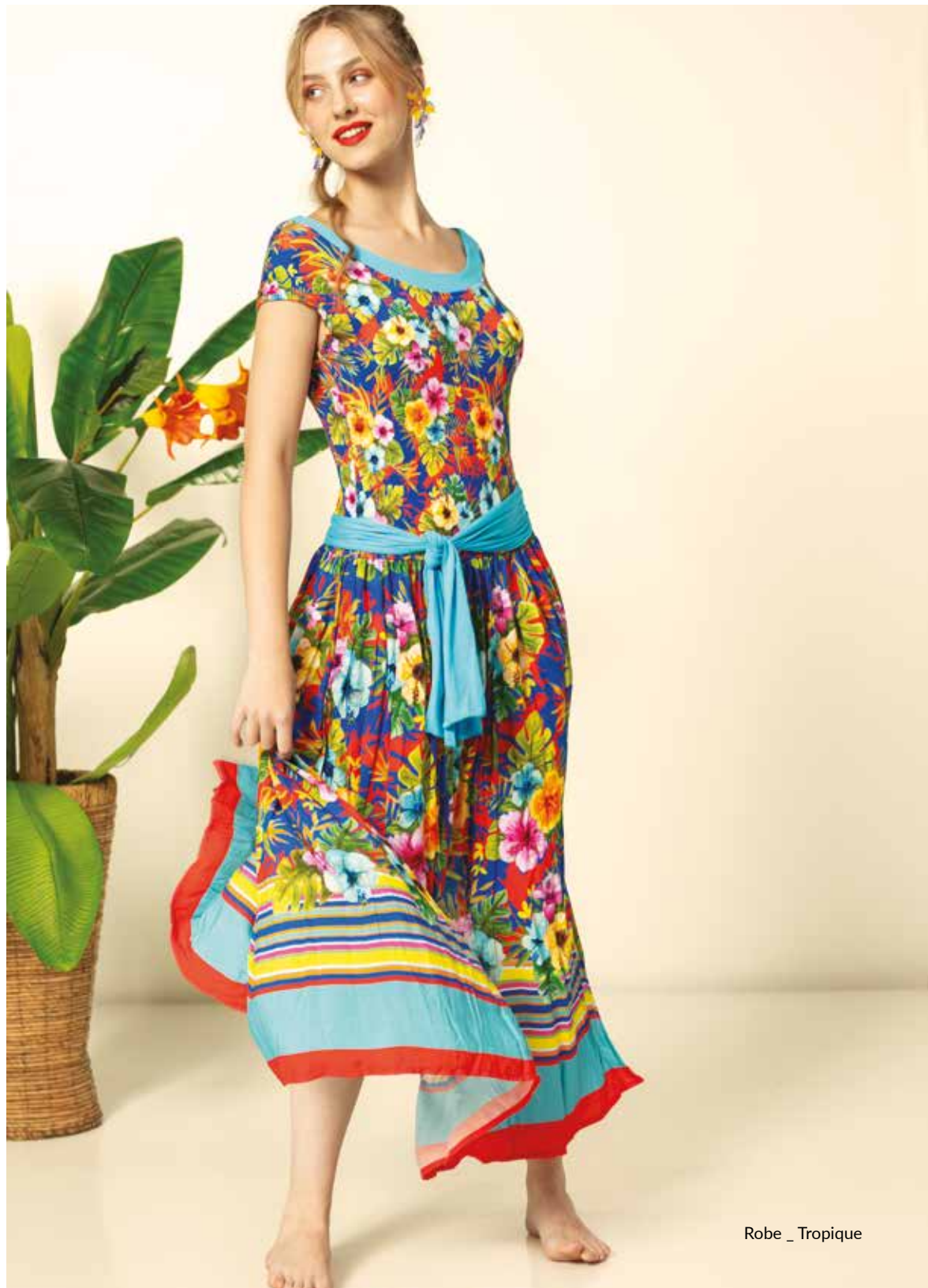
Robe _ Tropicque