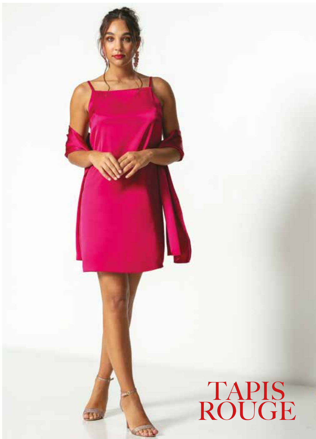
Robe _ Opéra Châle _ Festival