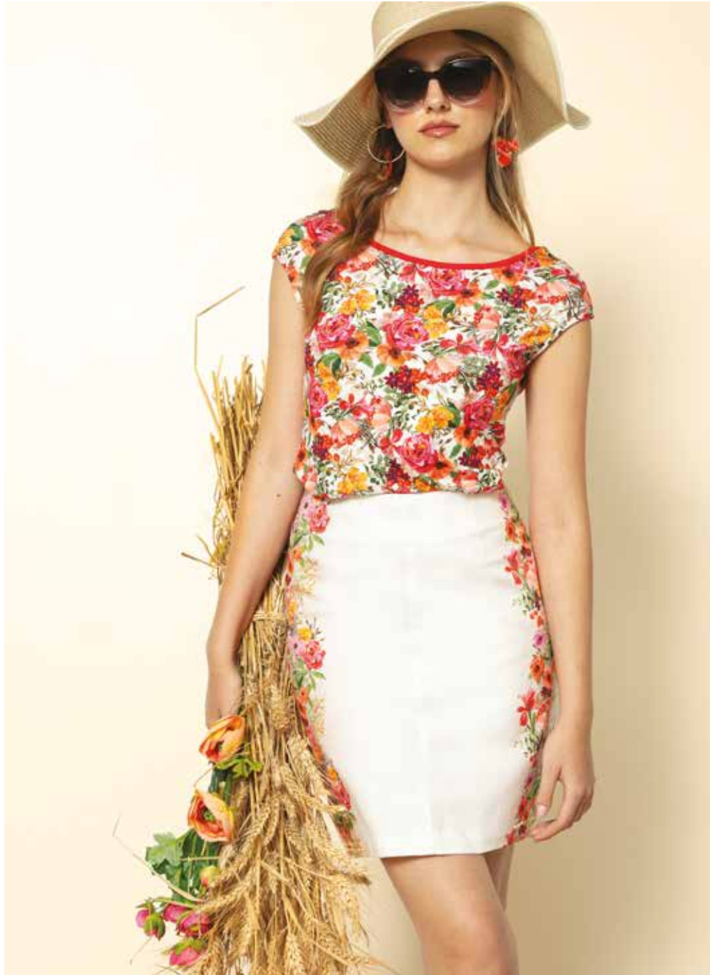
Jupe _ Promenade Tshirt _ Flanerie