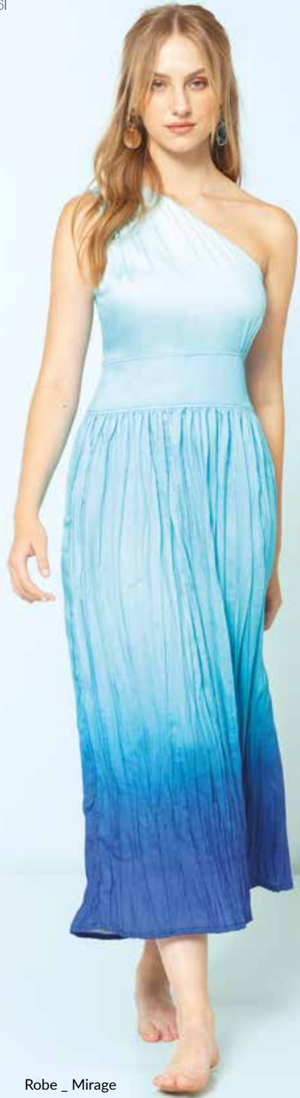
Robe _ Mirage