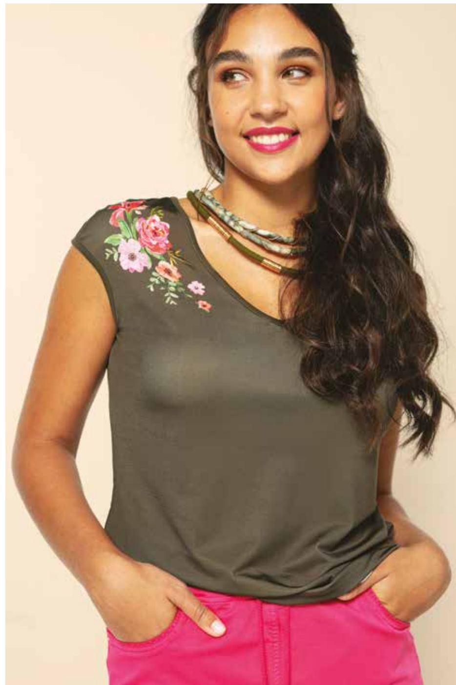
Tshirt _ Périple