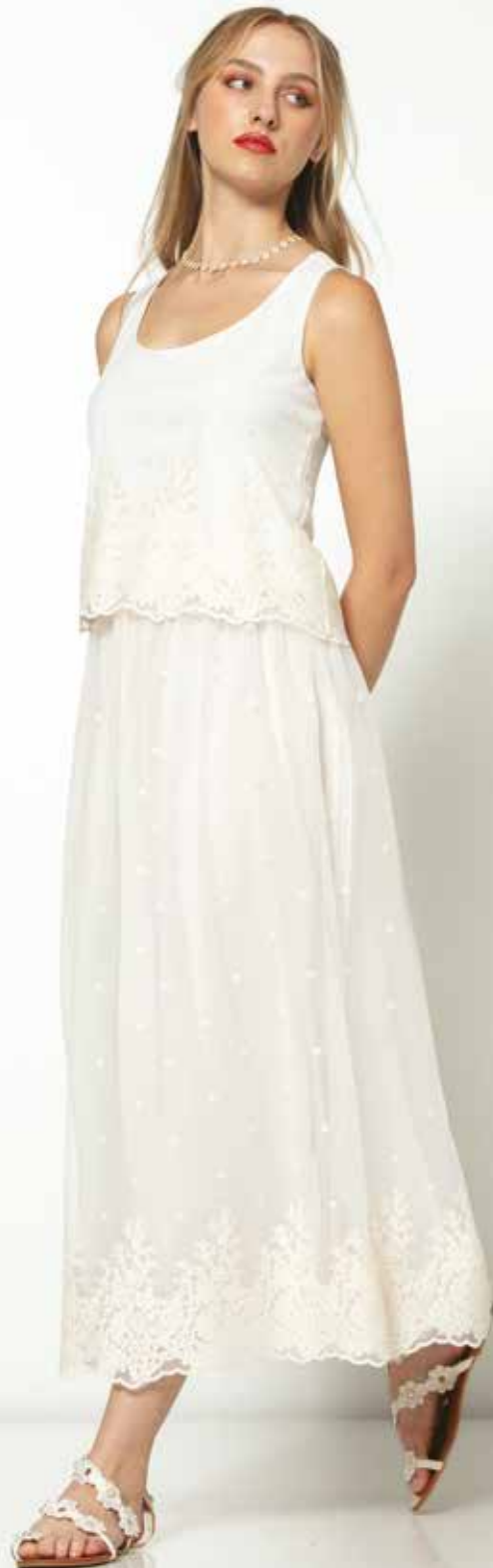
Jupe _ Diamant long Top _ Celeste