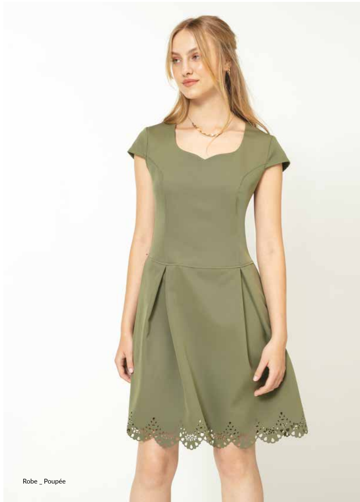
Robe _ Poupée