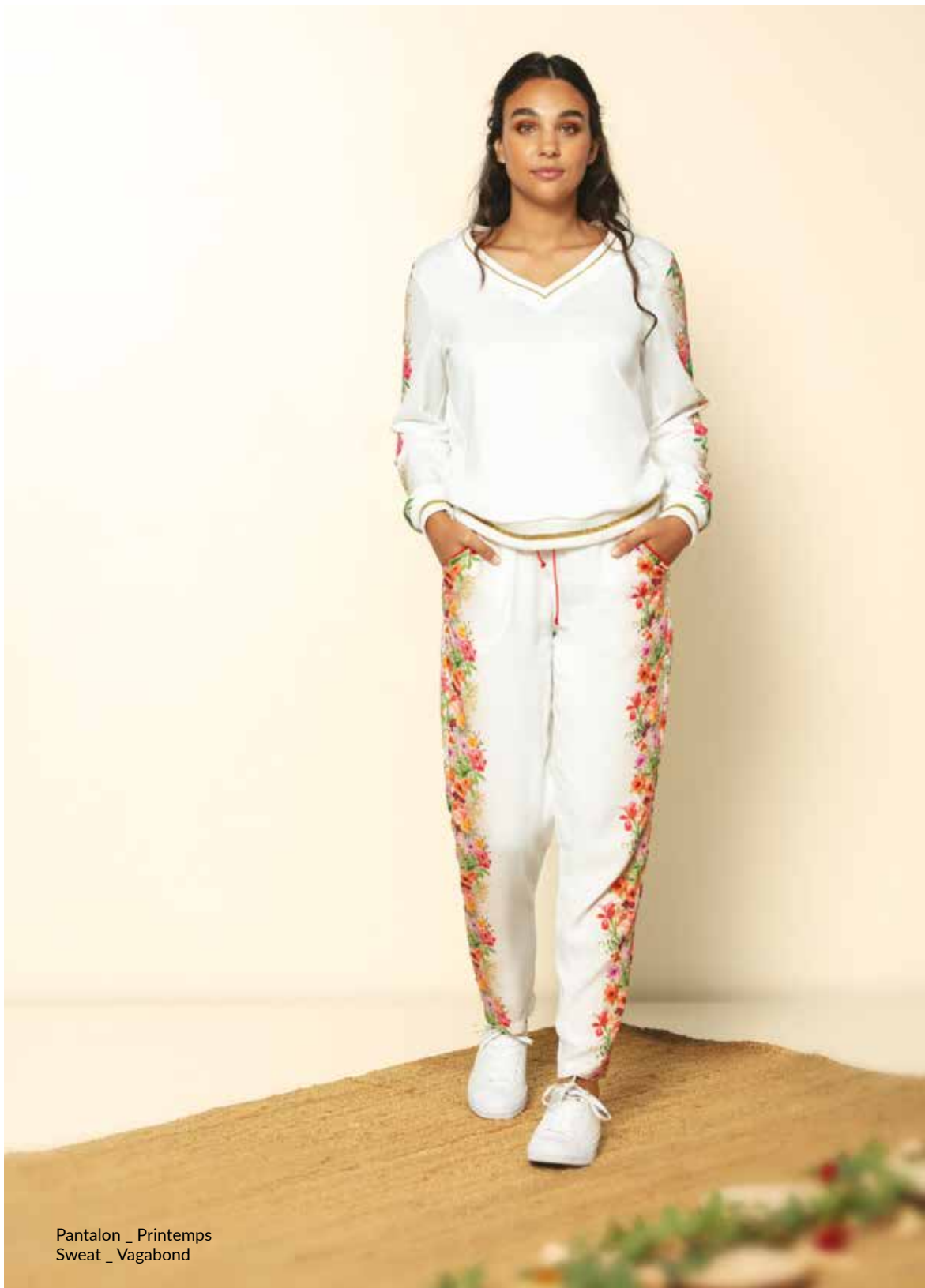
Pantalon _ Printemps Sweat _ Vagabond