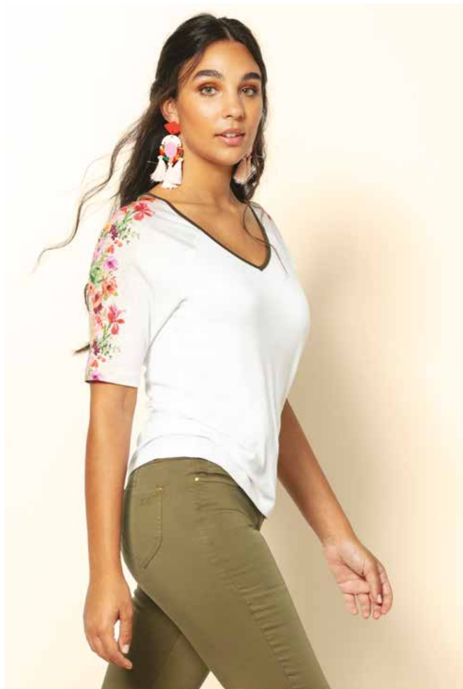
Pantalon _ sniky 7/8e Tshirt _ Primevère