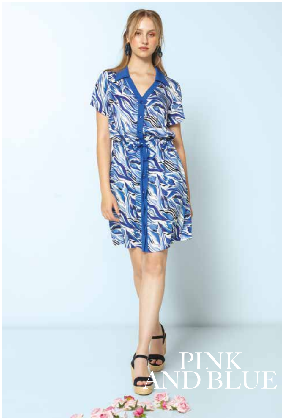
Robe _ Ondine