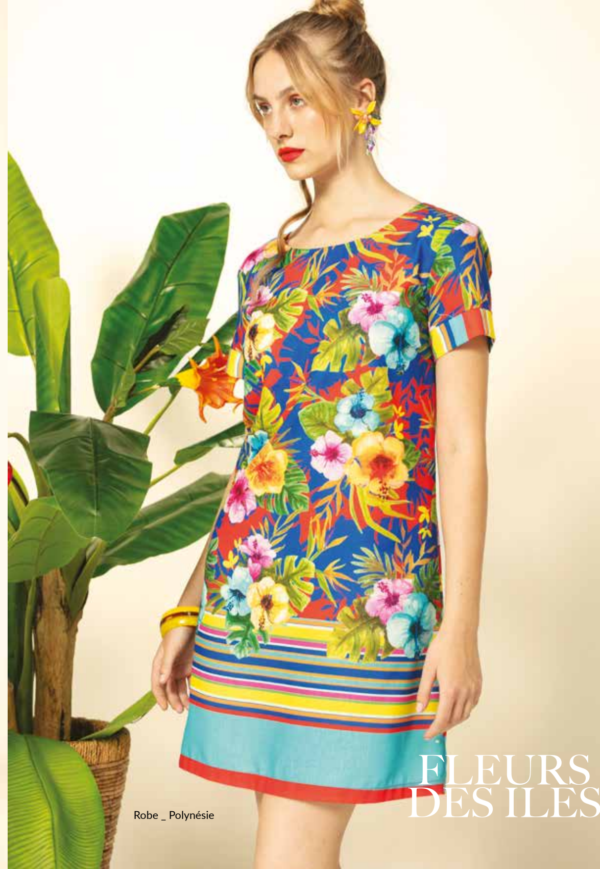
Robe _ Polynésie