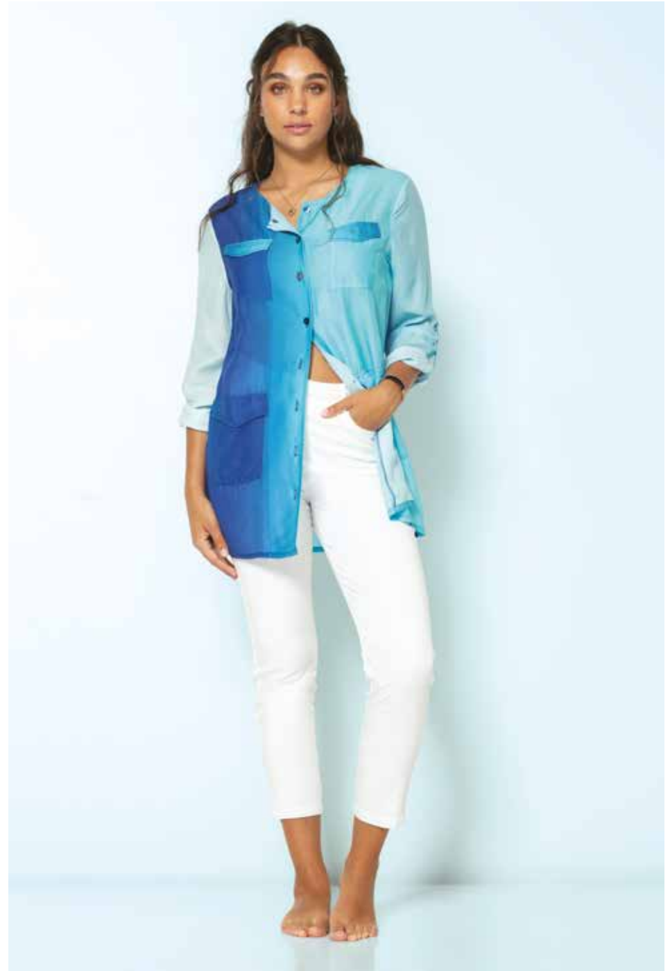
Pantalon _ Sniky 7/8e Chemise _ Utopie