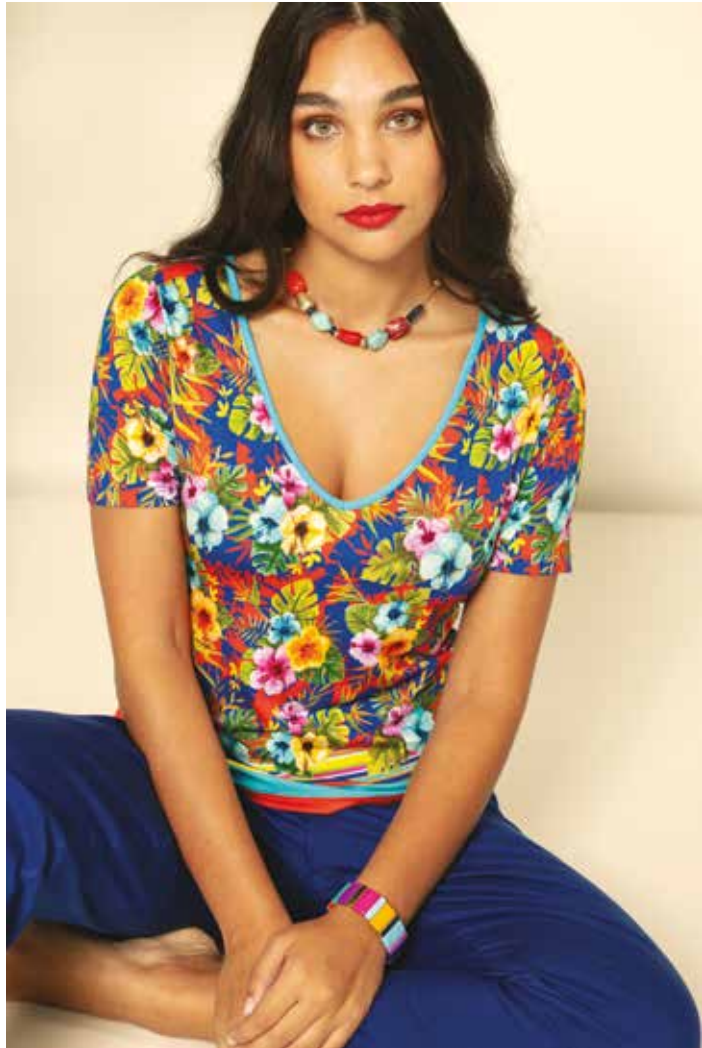
Tshirt _ BoraBora Pantalon _ Cigarette