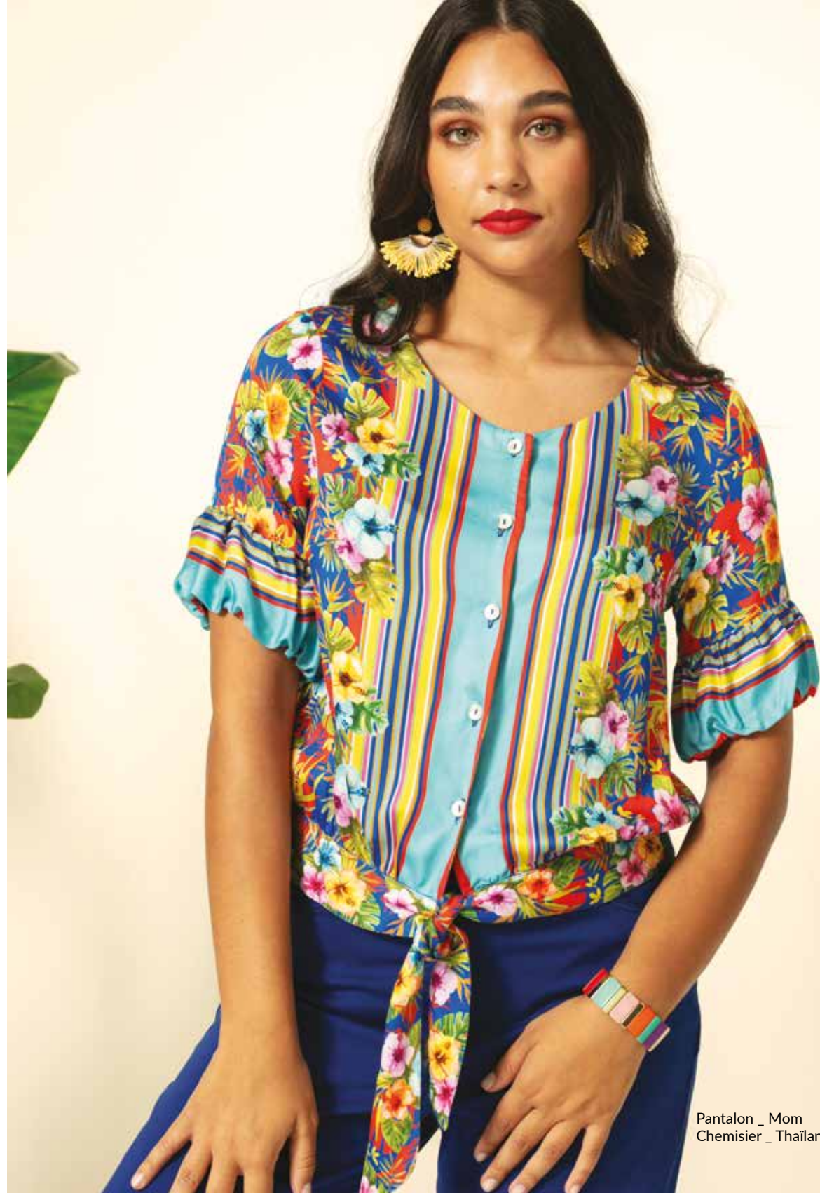
Pantalon _ Mom Chemisier _ Thaïlande