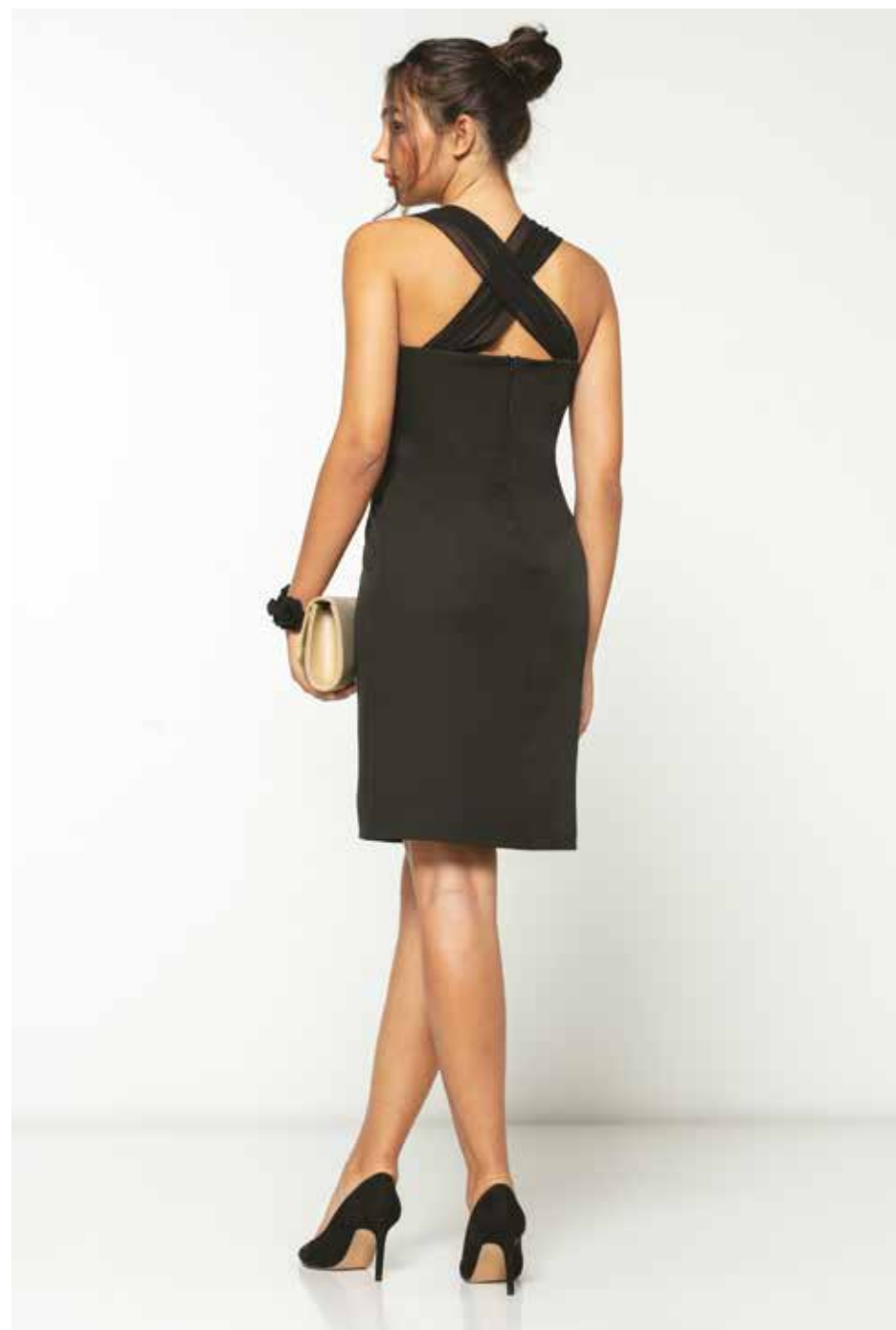
Robe _ Divine