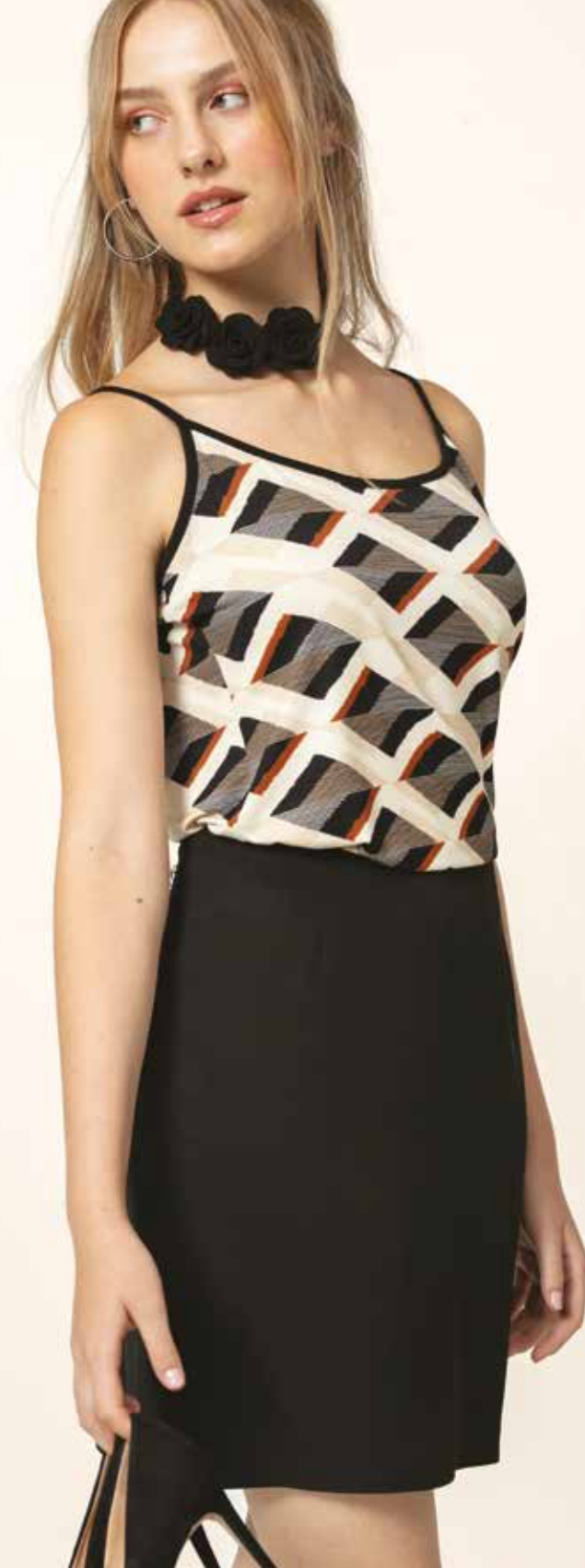
Jupe _ Princesse Débardeur _ Impression